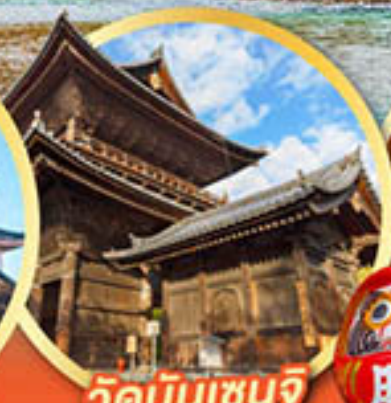
วัดนินเซินจิ