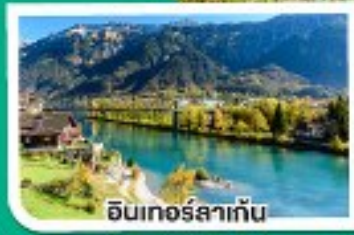
อินเทอร์ลาเก็น