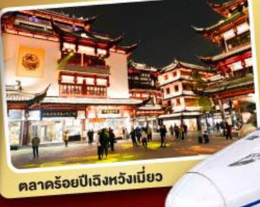
ตลาดร้อยปีเมืองหวงเหมียว