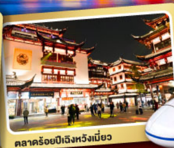
ตลาดร้อยปีเจิ้งหวิงเมี่ยว