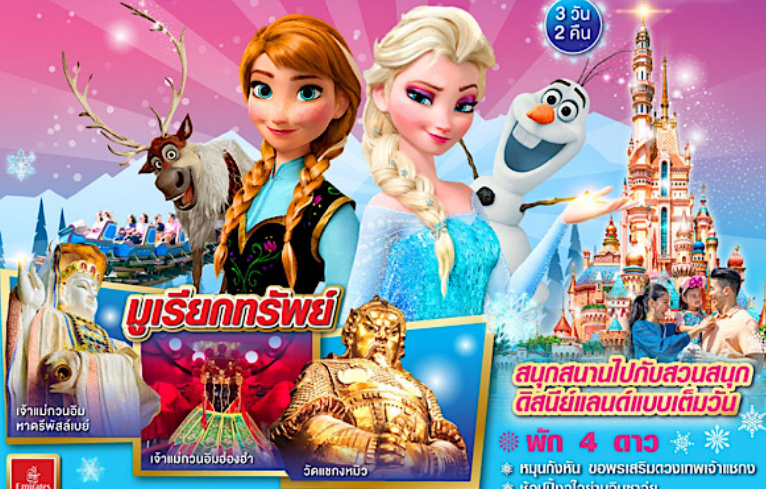
เจ้าแม่กวนอิม หาคิรีพัลลภย์