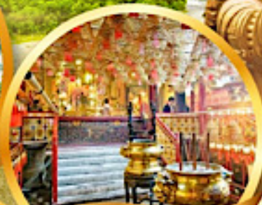
วัดหมื่นโหม่