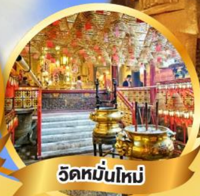
วัดมื่นใหม่