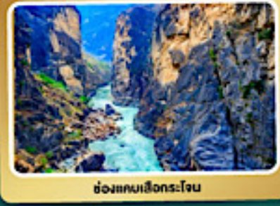
ช่องแคบเลียงกระโจน