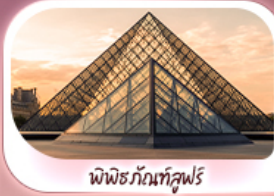
พีพริกันท์คูฟร์