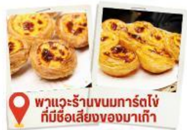
พวแจะร้านขนมการ์ตไข่ ที่มีชื่อเสียงของมาเก๊า

สถานที่นี้โดดเด่นไปด้วยสถาปัตยกรรมตะวันตก ตกแต่งด้วยเสาแบบโรมันและรูปปั้นนักบุญสำคัญของศาสนาคริสต์ แต่เดิมเป็นโบสถ์ที่ใหญ่ที่สุดในมาเก๊า สร้างขึ้นตั้งแต่ปี ค.ศ. 1602-1637 เพื่อเป็นศูนย์รวมแรงศรัทธาของชาวคริสต์ แต่แล้วก็เกิดเหตุไฟไหม้จากห้องครัวของโบสถ์เมื่อปี ค.ศ. 1835 ลูกกลมไปทั่วจนทำให้ตัวโบสถ์พังทลายเหลือเพียงส่วนหน้าประตูที่ยังไม่ถูกทำลาย จนกระทั่งปี ค.ศ. 1991 ที่มีการบูรณะซากประตูโบสถ์อีกครั้ง ทำให้ที่นี่กลายเป็นหนึ่งในสถานที่ท่องเที่ยวที่มีความสำคัญต่อประวัติศาสตร์มาเก๊า และได้รับการยกย่องให้เป็นมรดกโลก