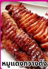
หมูแดงกวางตุ้ง