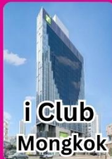
i Club Mongkok

คอนเฟิร์มเดินทาง 23-25 ตุลาคม 2567 พัก 4 ดาวย่านช้อปปิ้ง i CLUB MONGKOK