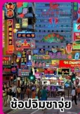
ช้อปปิ้งชาบู