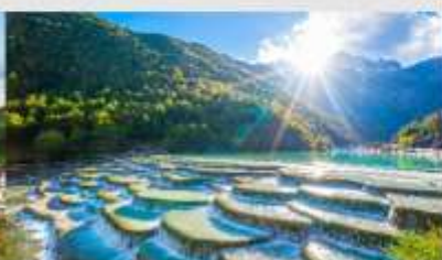
ทะเลสาบไป๋สุ่ยเหอ