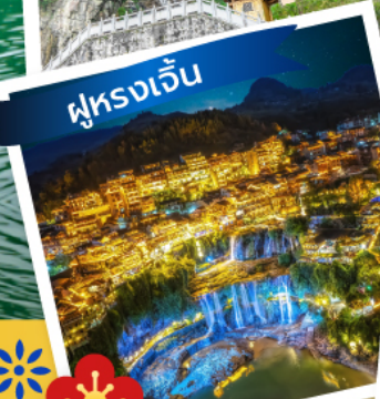
ฟูรงเจิน