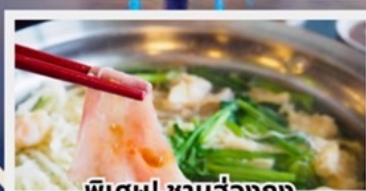
พิเศษ! ชาบูฮ่องกง