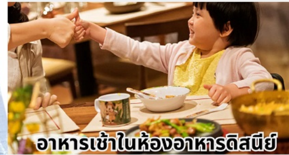
อาหารเข้าในห้องพักอาหารดิสนีย์