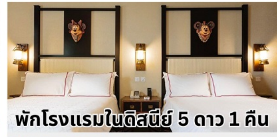
พักโรงแรมในดิสนีย์ 5 ดาว 1 คืน