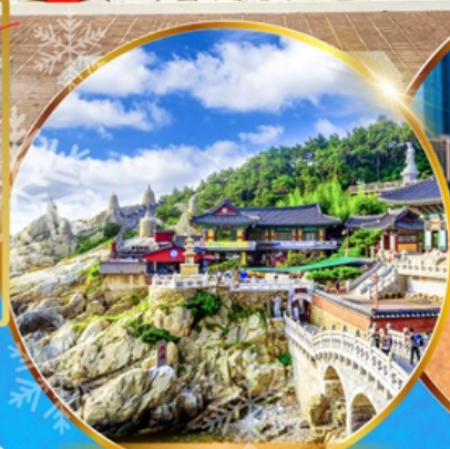
วัดแฮดงยงกุงซา