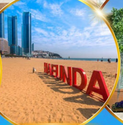
หาดแฮนแด