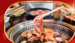
บุฟเฟ่ต์ปิ้งย่าง ไม่อั้น

KOREAN AIR บริการอาหารร้อน peach เอนเตอร์เทนเมนท์พี