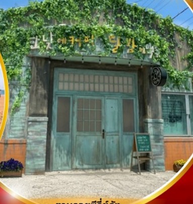
ตามรอยซีรีส์ดัง Hometown chachacha

โพฮังสเปซวอล์ก สกายวอร์ค ตามรอยซีรีส์ Hometown chachacha ถ่ายรูปชิคๆ หมู่บ้านวัฒนธรรมคิมซอน ขึ้นเคเบิลคาร์ ชมทะเลปูซาน นั่งรถไฟปู๊กบีก sky capsule ชิมของอร่อยตลาดแฮუნแด อิสระช้อปปิ้ง Lotte Duty Free