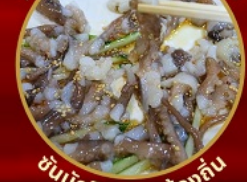
ชั้นนักจ๊อ อาหารท้องถิ่น