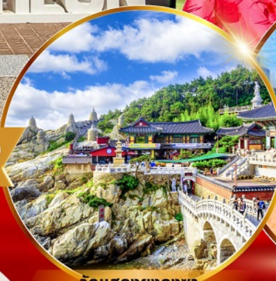
วัดแสงยงกุงซา