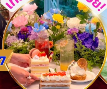
คาเฟ่ดัง Forest Outing