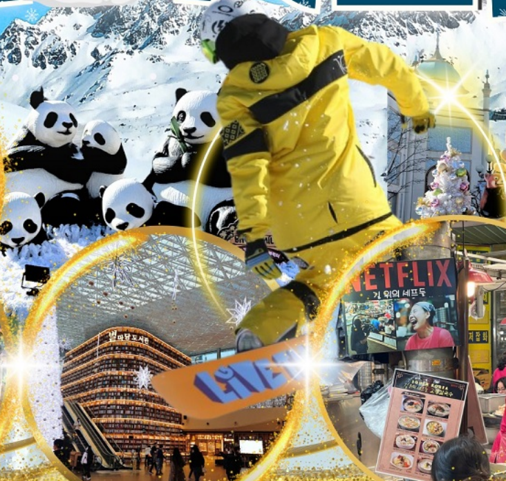
ห้องสมุด Starfield