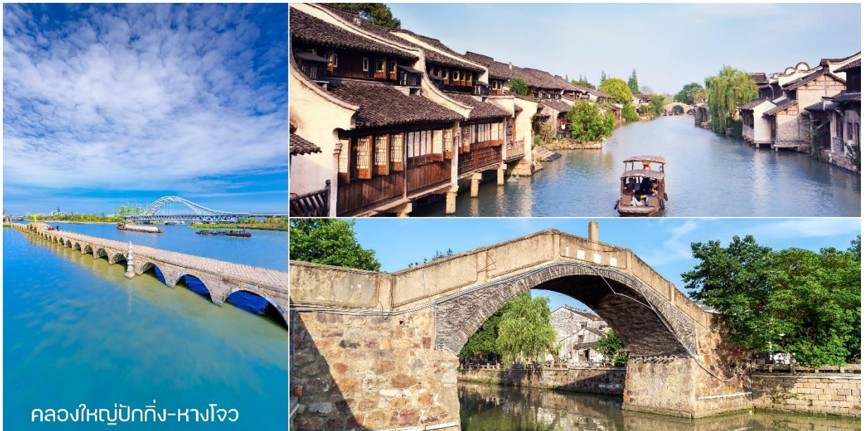
คลองใหญ่ปักกิ่ง-หางโจว

จากนั้นนำท่านลงเรือ คลองใหญ่ปักกิ่ง-หางโจว ( Beijing-Hangzhou Grand Canal ) ซึ่งเป็นคลองขุดที่เก่าแก่และยาวที่สุดในโลก ได้เปิดพื้นที่คลองในส่วนเมืองหางโจวให้ท่องเที่ยวแล้วเมื่อวันที่ 1 กันยายนที่ผ่านมา เพื่อเปิดโอกาสให้ผู้มาเยือนได้ชื่นชมกับสุดยอดคลองขุดที่มีมาอย่างยาวนานของจีน คลองใหญ่ปักกิ่ง-หางโจว มีความยาวถึง 1,794 กิโลเมตร (1,115 ไมล์) ทั้งยังมีประวัติศาสตร์นานกว่า 2,500 ปี เริ่มตั้งแต่กรุงปักกิ่งทางตอนเหนือ ทอดยาวไปสุดที่เมืองหางโจวทางตอนใต้ของประเทศ และทำหน้าที่เป็นเส้นเลือดหลักในการเดินทางสมัยจีนโบราณ โดยหนึ่งในแปดของคลองนี้ทอดผ่านเมืองหางโจว ห่างจากกรุงปักกิ่งไปประมาณ 180 กิโลเมตร ยังถูกยกให้เป็นมรดกโลกเมื่อปี 2557 ด้วย จากนั้นให้ท่านได้เดินชมถนนหมู่บ้านวัฒนธรรม Xiaohu Street Historic หมู่บ้านคนเดินวัฒนธรรมที่มีชีวิตชีวาและน่ารัก ร้านกาแฟเล็กๆ ที่มีอาหารและชาและกาแฟ ร้านเสื้อผ้าสไตล์วินเทจ นอกจากนี้ยังมีร้านอาหารที่สามารถมองเห็นวิวแม่น้ำซึ่งสวยงามมากแนะนำมาก นำท่านชม สะพานกงเฉิน ( Gongchen Bridge )