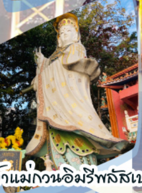
เจ้าแม่กวนอิมรัพลัสเบง