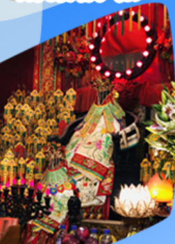
เจ้าแม่กวนอิมซี่มเงิน