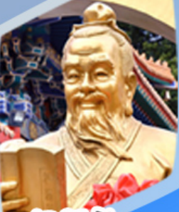
หลวงดำเซ็งน