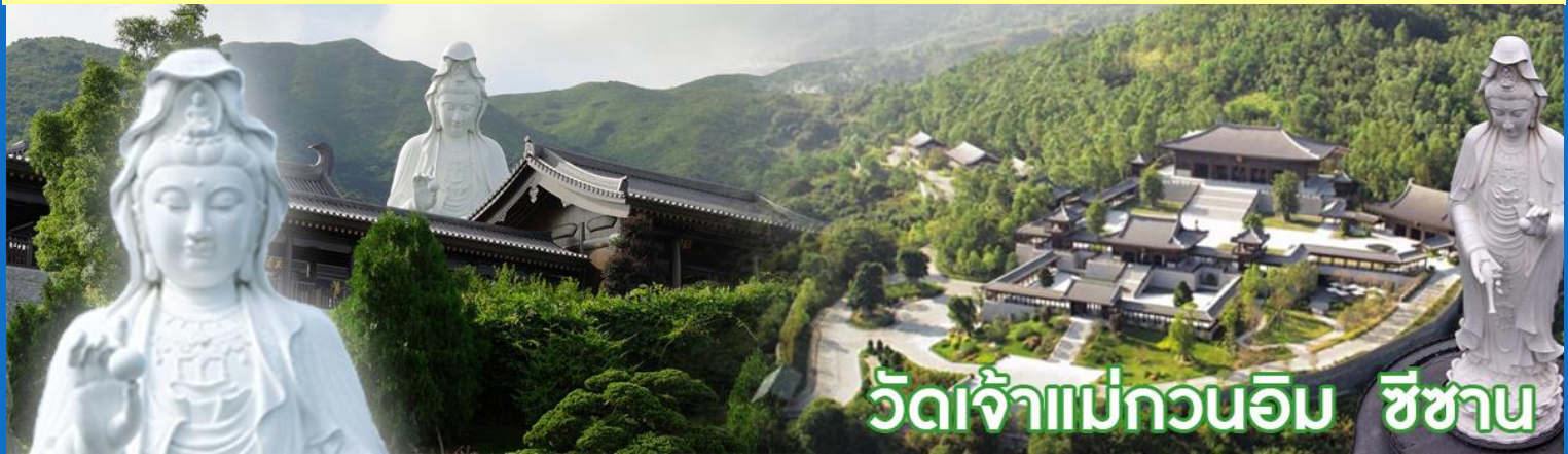
วัดเจ้าแม่กวนอิม ชีซาน

วัดชีซาน หลายคนที่เคยไปเที่ยวฮ่องกงมาแล้ว อาจจะยังไม่เคยเยือนวัดชีซาน หรือ Tsz Shan Monastery เป็นวัดที่มีเจ้าแม่กวนอิมองค์ใหญ่เป็นอันดับสองของโลก มีความสูงถึง 76 เมตร ตั้งอยู่บนเนื้อที่กว่า 29 ไร่ ในเกาะฮ่องกง โดยมีนาย ลี กาชิง มหาเศรษฐีชื่อดังของฮ่องกง บริจาคเงินสร้างวัดถึง 193 ล้านดอลลาร์เลยทีเดียว