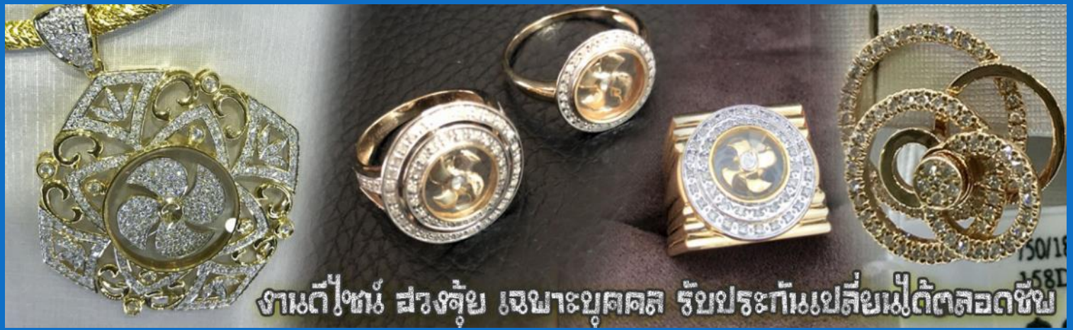
งานดีไหม? สวยๆ ชูชัชวาลย์ งามประทีปเปลี่ยนไม่ติดตลอดชีพ

จากนั้นนำท่านสู่ ร้านหยก ชมความงามปีเซียะ ที่เชื่อกันว่าเป็นวัตถุมงคลยอดนิยม ที่มีการนำมาบูชา เพื่อให้ช่วยป้องกันสิ่งชั่วร้าย เรียกทรัพย์สินเงินทองให้ไหลมาเทมา และกักเก็บทรัพย์นั้นไม่ให้รั่วไหลออกไปไหนได้ ชาวจีนโบราณเชื่อกันว่า ปีเซียะเป็นสัตว์ประหลาดที่รวมลักษณะของสัตว์มงคลทั้ง 5 ชนิดไว้ด้วยกัน ได้แก่ มังกร พญาราชสีห์หรือสิงโต, อินทรี, กวาง, และแมว โดยตามตำนานเล่าว่า ปีเซียะเป็นลูกมังกรตัวที่ 9 (เทพแห่งโชคลาภ) ของพญามังกรสวรรค์ มีชื่อเรียกด้วยกันหลายชื่อไม่ว่าจะเป็น “เทียนลก (กวางสวรรค์)” เป็นชื่อเดิม ส่วนจีนกวางตุ้งจะเรียกว่า “เผ่ฮ่า” และคนจีนแต้จิ๋วจะเรียกว่า “พีซิว” และยังมีจำหน่ายยาสมุนไพรบำรุงเพิ่มความแข็งแรงตามความเชื่อของคนฮ่องกง