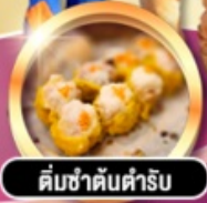
ติ่มซำคันทาร์รับ