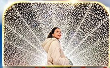
ชมงานประดับไฟนาบานา โนะ ซาโตะ