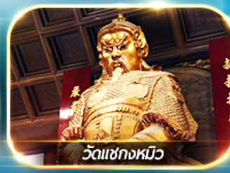
วัดเข็กงหมิว