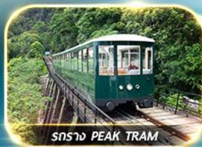
สราง PEAK TRAM