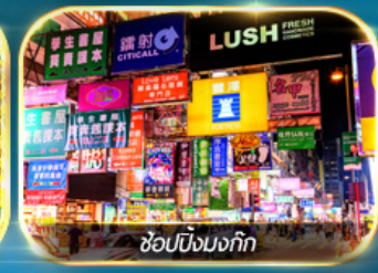
ช้อปปิ้งมอลล์

เต็มอิ่มทั้งบุญ และ ช้อปปิ้งแบบจัดเต็ม จิมซาจู้ย มงก๊อก