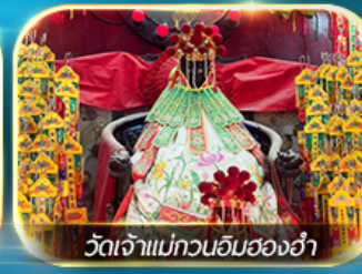
วัดเจ้าแม่ทวนอิมสองอ่า