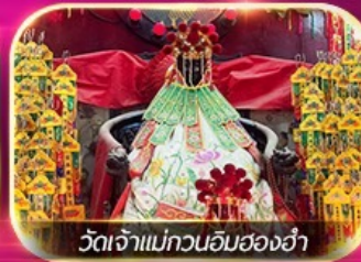
วัดเจ้าแม่กวนอิมฮ่องกง