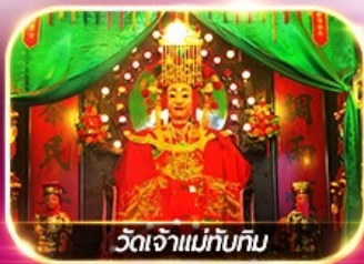
วัดเจ้าแม่ทับทิม