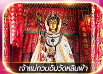
เจ้าแม่กวนอิมวัดหลินฟ้า