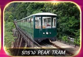
รถราง PEAK TRAM

เต็มอิ่มทั้งบุญ และ ช้อปปิ้งแบบจัดเต็ม จิมซาจุ่ย มงก๊ก