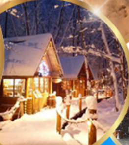
หมู่บ้านเทพนิยาย นิงเกิลทอเรส