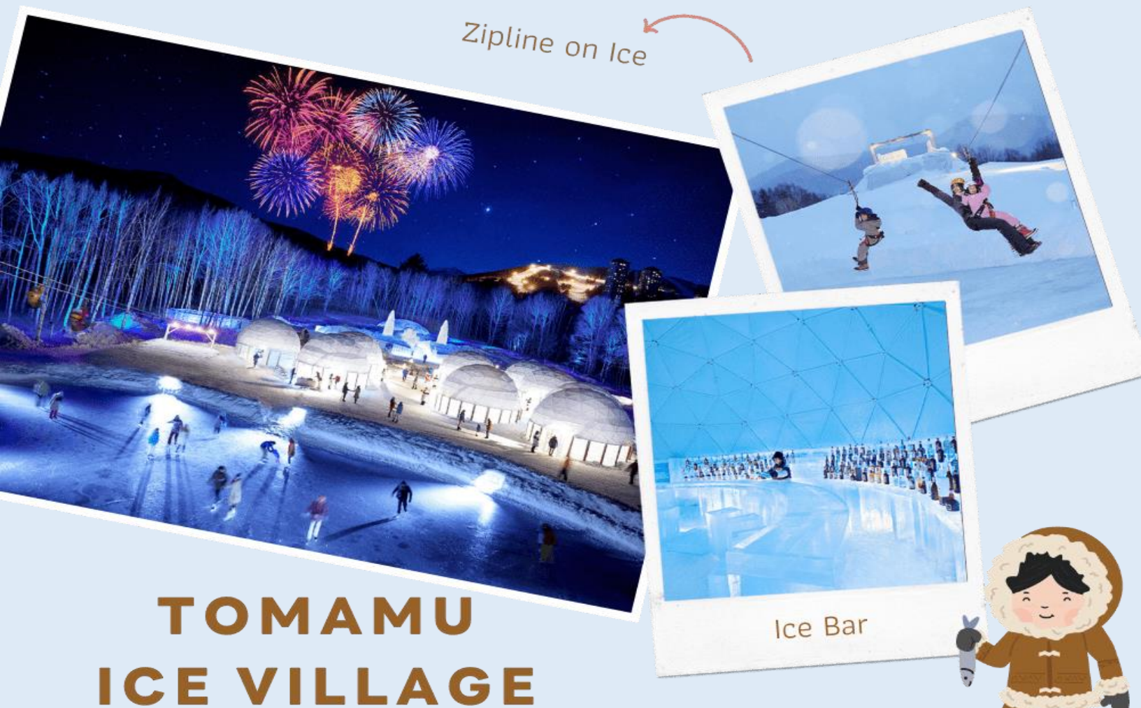
Zipline on Ice

หลังรับประทานอาหารกลางวัน นำท่านเดินทางสู่ TOMAMU ICE VILLAGE ซึ่งตั้งอยู่ใน โฮชิโนะรีสอร์ทโทมามุ (Hoshino Resort Tomamu) เป็นหมู่บ้านชั่วคราวที่สร้างขึ้นจากการแกะสลักน้ำแข็งในช่วงฤดูหนาวเท่านั้น บ้านน้ำแข็งแต่ละหลังมีการประดับประดาแสงไฟสีสันต่าง ๆ ให้งดงามมากยิ่งขึ้น นอกจากนี้ให้การเก็บภาพความสวยงามของบ้านน้ำแข็งแล้วยังมีกิจกรรมอื่น ๆ อีกมากมาย เช่น Zipline on Ice จะเคลื่อนตัวลงมาเป็นระยะทางประมาณ 60 เมตร ระหว่างทางคุณจะได้ชื่นชมทิวทัศน์ของหิมะ และลานน้ำแข็งที่น่าอัศจรรย์ Ice Bakery & Cafe คาเฟ่ที่ให้บริการเครื่องดื่มร้อน และขนม ที่ให้ท่านนั่งทานบนโต๊ะและเก้าอี้น้ำแข็ง Ice Bar บาร์ที่บริการเครื่องดื่มประเภทค็อกเทล และเครื่องดื่มแอลกอฮอล์อื่น ๆ หลายชนิด ที่เสิร์ฟในแก้วน้ำแข็งสวย ๆ เป็นต้น (**ราคาทัวร์ไม่รวมค่ากิจกรรมและค่าเครื่องดื่ม Ice Bar, Ice Bakery&Cafe**)