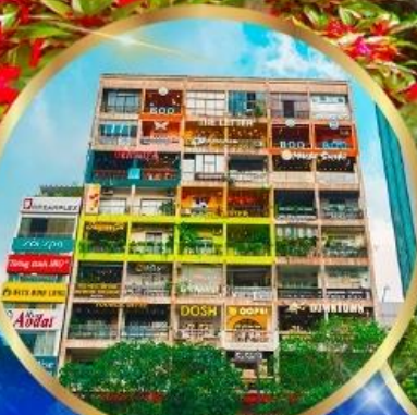
คาเฟ่ อพาร์ทเมนต์