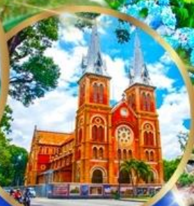
โบสถ์นอร์ทเธอดาม