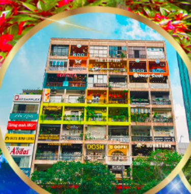
คาเฟ่ อพาร์ทเมนต์