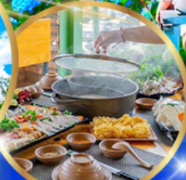
พิเศษ บุฟเฟ่ต์ 2 มื้อ