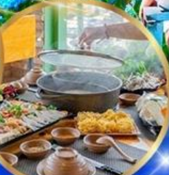
พิเศษ บุฟเฟ่ต์ 2 มือ