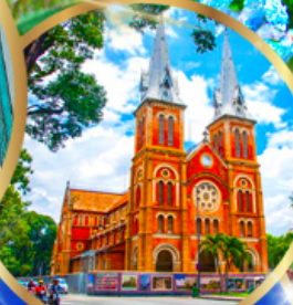
โบสถ์นอร์ทเธอดาม