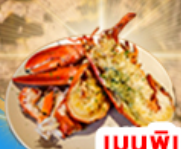
เมนูพิเศษ! "กุ้งล็อบสเตอร์"