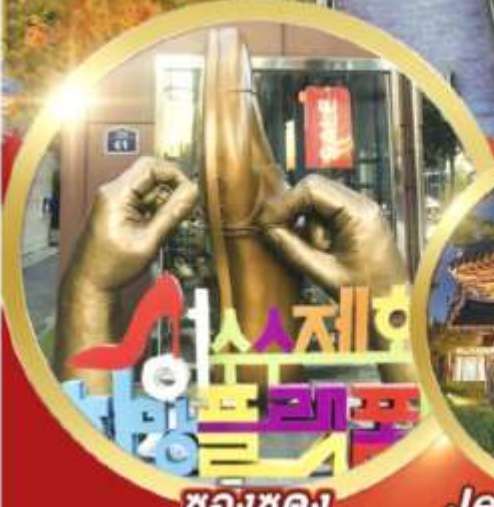
ซองชูดง วอร์ดกึ่งสตรีท