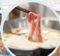
เมนูพิเศษ สุกินมาล่า