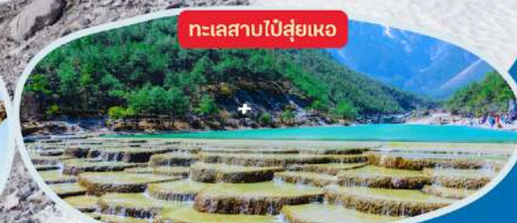
ทะเลสาบไ้ส่วยเหอ