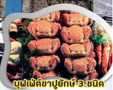
บุฟเฟ่ต์ซาปูยักษ์ 3 ชนิด

บิน Full service สายการบินไทย น้ำหนักกระเป๋า 25 กก. **เที่ยวเต็มทุกวัน อาหารครบทุกมื้อ**