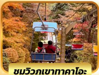
ชมวิวกุเขาทาคาโอะ