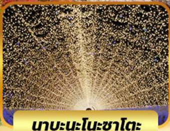
นาบะนะโนะซาโตะ