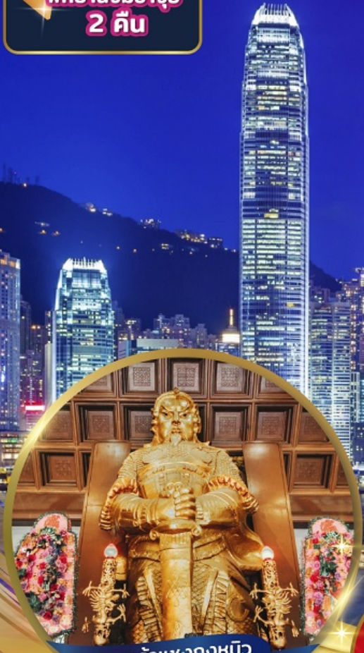
เทพเจ้าเซ่งกงหมิว (วัดเซ่งกงหมิว)