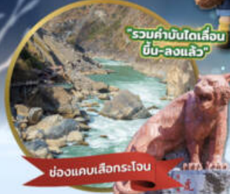
ช่องแคบเล็องกระโจน