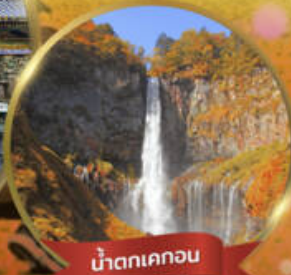
น้ำตกเคคอน