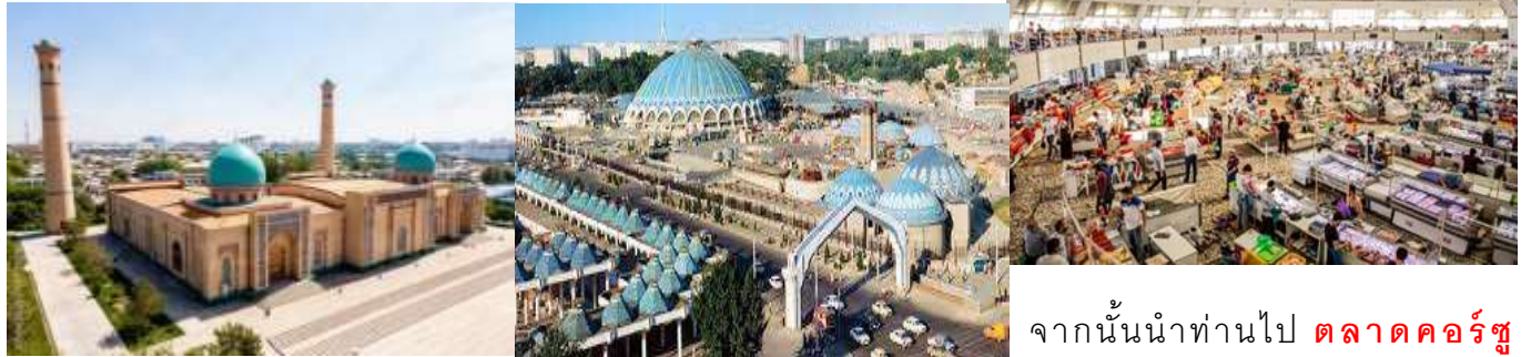
จากนั้นนำท่านไป ตลาดคอร์ซุ

เช้า บริการอาหารเช้า ณ ห้องอาหารของโรงแรม 10.00 น. นำท่านชม มหาวิหารอัสสัมชัญ (Holy Assumption Cathedral Church) มหาวิหารอัสสัมชัญของพระแม่มาเรีย สร้างขึ้นในปี ค.ศ. 1871 และถูกขยายในปี ค.ศ. 1990 หอระฆังถูกสร้างขึ้นใหม่ในปี 2010 ตัวอาคารเป็นสีฟ้าและยอดโดมเป็นสีทองเด่นเป็นสง่า เป็นศิลปะแบบ Russian Orthodox ที่มีความสวยงามและใหญ่ที่สุดในภูมิภาคเอเชียกลาง เที่ยง บริการอาหารกลางวัน ณ ห้องอาหาร บ่าย นำท่านสัมผัสความงดงามของกลุ่มสถาปัตยกรรม Khazrati Imam complex ซึ่งเป็นบริเวณสถานที่อันศักดิ์สิทธิ์เก่าแก่ของชาวมุสลิมที่มีมาตั้งแต่ศตวรรษที่ 6 เป็นศูนย์รวมจิตวิญญาณของชาวมุสลิมของภูมิภาคนี้ ที่เดินทางผ่านมาบริเวณนี้ต้องมาทำความเคารพและสักการะบูชา ประกอบไปด้วยสิ่งปลูกสร้างที่ยิ่งใหญ่ เช่น มัสยิด โรงเรียนสอนศาสนาและพิพิธภัณฑ์ที่เก็บรวบรวมคัมภีร์กุรอานเก่าแก่ไว้มากมาย อีกทั้งยังเป็นทีเก็บรักษาคัมภีร์กุรอานที่มีขนาดใหญ่ที่สุดอีกด้วย..