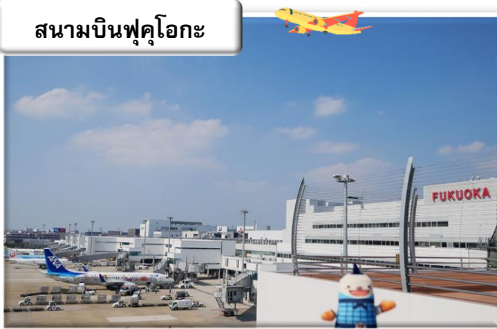
สนามบินฟุคุโอกะ

เวลา 00.55 น. ออกเดินทางสู่ สนามบินฟุคุโอกะ ประเทศ ญี่ปุ่น โดย สายการบินไทย เที่ยวบินที่ T5648