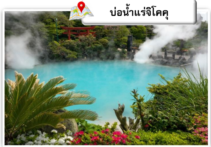
บ่อน้ำแร่จิโคคุ

เดินทางสู่ บ่อน้ำพุร้อน (Jigoku Meguri) หรือ บ่อน้ำพุร้อนชุมชนรททั้งแปด เป็นบ่อน้ำพุร้อนธรรมชาติที่เกิดขึ้นภายหลังจากการระเบิดของภูเขาไฟ ประกอบไปด้วยแร่ธาตุที่เข้มข้น เช่น กำมะถัน แร่เหล็ก โซเดียม คาร์บอเนต เรเดียม เป็นต้น และร้อนเกินกว่าจะลงไปอาบได้ แล้วบ่อทั้ง 8 บ่อ ก็ตั้งชื่อให้หน้ากลัวตามลักษณะภายนอกที่เห็นกัน