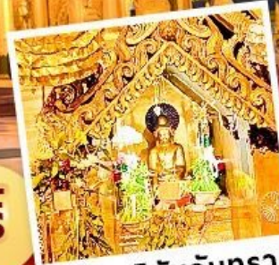
พระสุริยันจันทรา