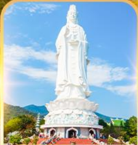
วัดหลินอึ้ง