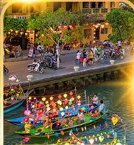
ล่องเรือลอยกระทง