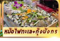
หม้อไฟทะเล+กุ้งมังกร