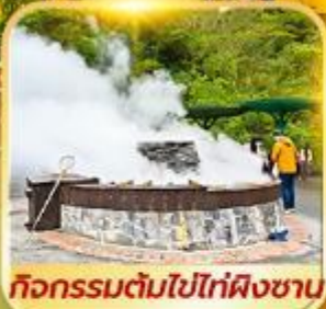
กิจกรรมต้มไข่ไท่ผิงซาน