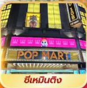
ซีเหมินติง