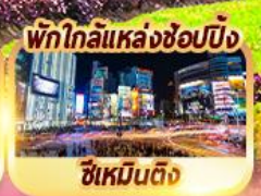
พักใกล้แหล่งช้อปปิ้ง