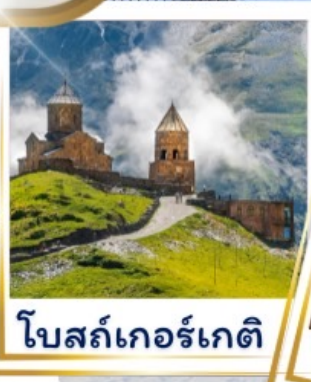
โบสถ์เกอร์เกติ