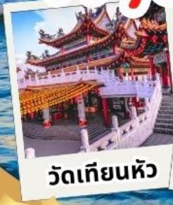
วัดเทียนหัว