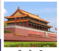
เทียนอันเหมิน

กำแพงเมืองจีนด่านจวิหยงกวน / สนามกีฬาปักกิ่ง / ช้อปปิ้งย่านซานหลี่ตุ๋น / วัดลามะ จัตุรัสเทียนอันเหมิน / พระราชวังโบราณกู้กง / หอประชุมเทียนถาน / พระราชวังฤดูร้อนอวิ๋เหอหยวน