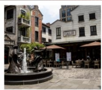
ซินเทียนตี้