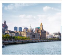
หาดว่าทาน