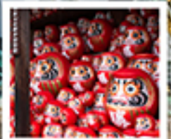
วัดคังดสึโฮจิ