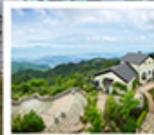
รถม้า: คาร์เด็น เกอร์เรซ