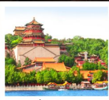
อวิ๋เหอหยวน