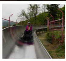
สไลเดอร์ลงจากกำแพงเมืองจีน