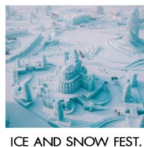
ICE AND SNOW FEST.

คฤหาสน์วอลการ์ (ฟรีเล่น Snow Tubing) โบสถ์เซนต์นิโคลัส / มู่ตันเจียง / ชมแสงสีกลางคืนถนนสายยูนิเจีย เขาแกะหิมะ / เขาปางดุย / ภาพเขียนสี ICE AND SNOW โบสถ์เซนต์ไซเฟีย / เกาะพระอาทิตย์ / เทศกาลแกะสลักน้ำแข็ง