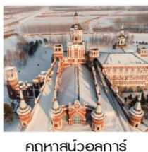
คฤหาสน์วอลการ์