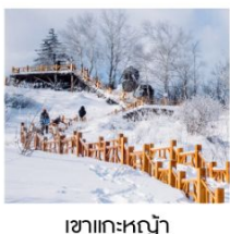
เขาแกะหิมะ

ฟรี!! ...ถุงมือ ผ้าพันคอ หมวก ท่านละ 1 ชุด