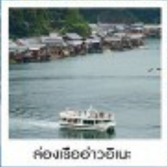
ค่องเรือฮาวายินะ