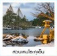
สวนคนโระกุเซ็น

วัดโองสึคันมง / ปราสาทนาโกย่า / สิงบิงซากาเอะ / ชิราคาวาโกะ / หมู่บ้านอิงาชิ ฮายะ / สวนคนโระกุเซ็น คิโทเนคิตสึยามะ / ค่องเรือฮาวายินะ / จุดชมวิวฮาบาโนะฮาชิคาเอะ / โทบะ ฮิบะชิ ฟูริเนียม เอคาทเค็ด